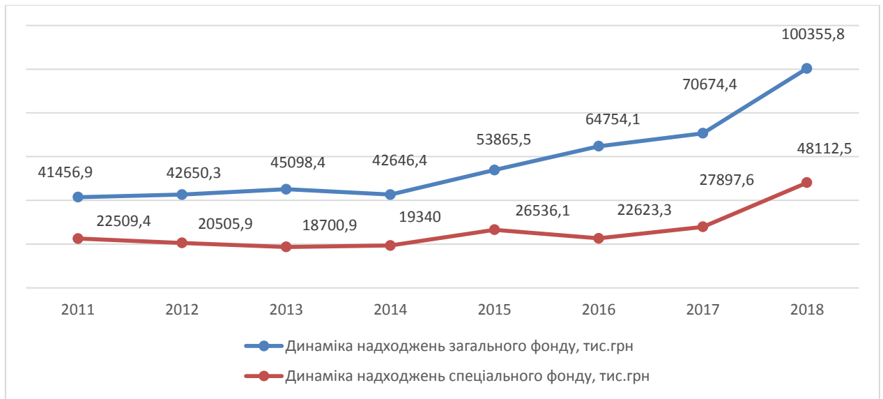
Рисунок 2. Динаміка надходжень коштів загального та спеціального фондів Миколаївського НАУ за 2011-2018 рр., тис. грн

На рисунку 2 наведені обсяги фінансування у 2011–2018 роках за загальним та спеціальним фондами.