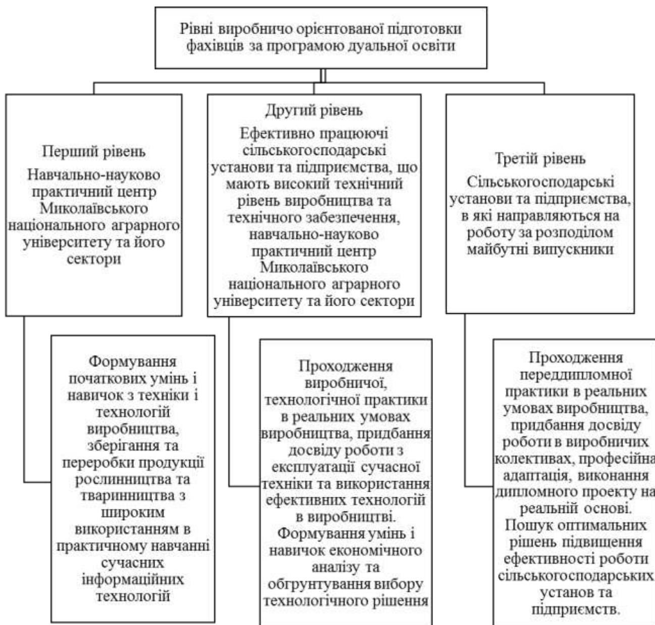
Рис. 2 – Підготовка фахівців за програмою дуальної освіти для АПК Миколаївської області

Розробка навчальних планів і освітніх програм мають враховувати виробничо орієнтовану підготовку фахівців (рис. 2).