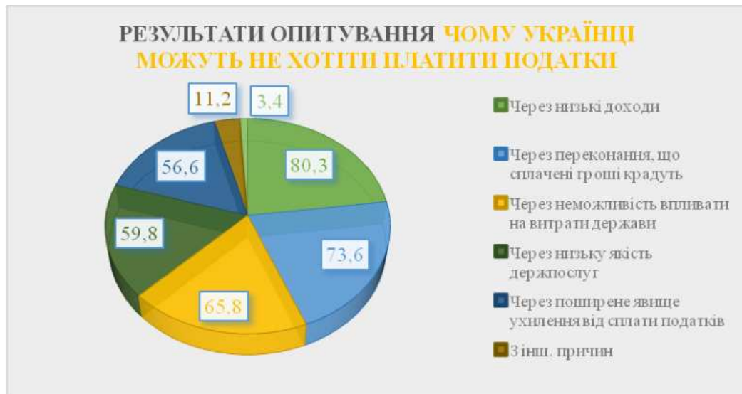
Рис. Результати опитування щодо причин небажання українців сплачувати податки, %

цьому причина в тому числі й вироблення серед населення тенденції несплати податків.