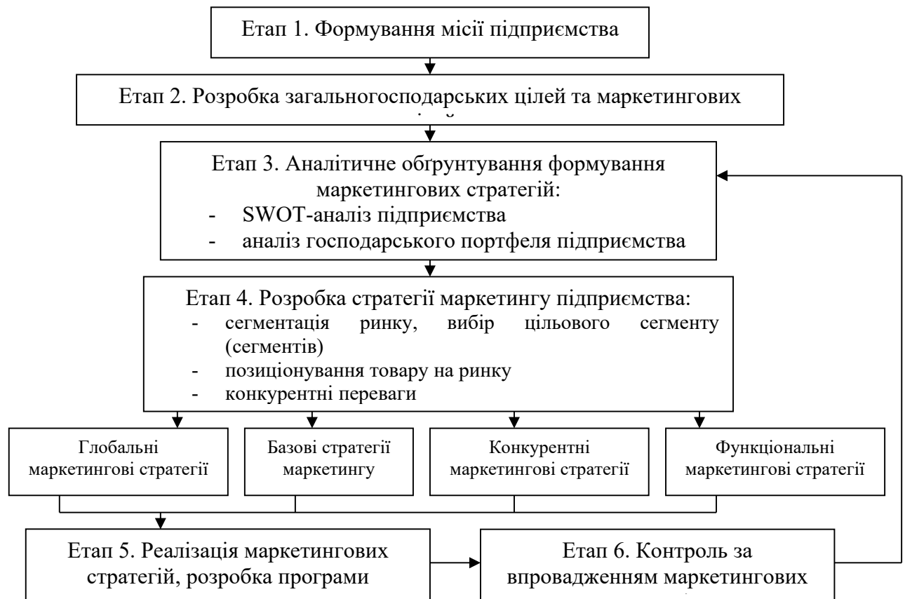
Рисунок 1 – Процес формування маркетингових стратегій підприємства

Отже, формування маркетингової стратегії є важливим процесом в здійсненні діяльності підприємств. Її актуальність посилюється кризовими явищами економіки України. Для розробки стратегії маркетингу необхідно сформулювати місію підприємства, визначити цілі, здійснити аналітичне обґрунтування, обрати цільові ринки, сформувати позицію продукції на ринку та розробити напрями маркетингової діяльності підприємства.