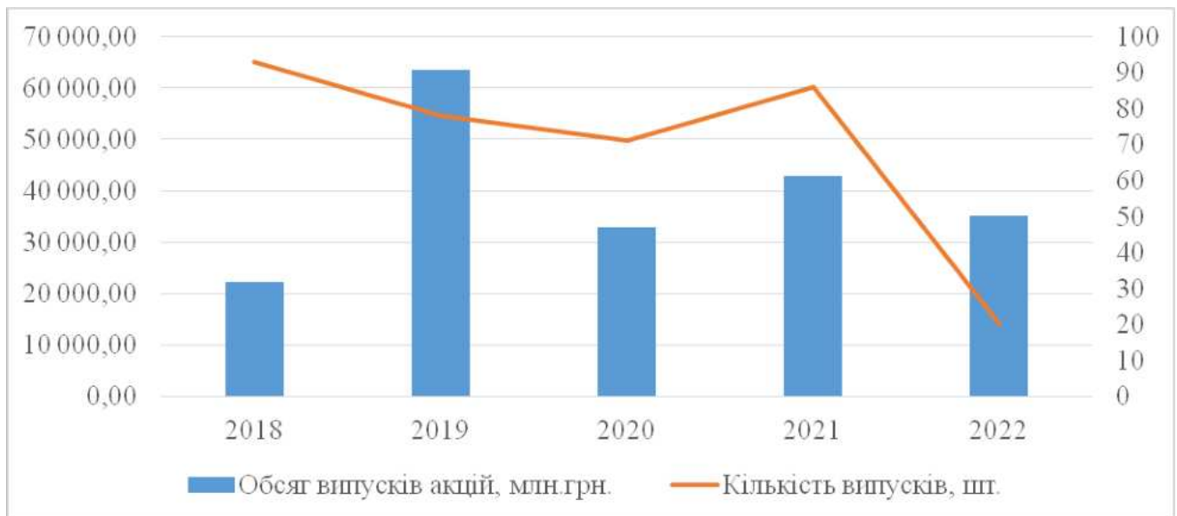
Рис. 1. Обсяг та кількість випусків акцій, зареєстрованих Комісією протягом 2018 – 2022 рр.