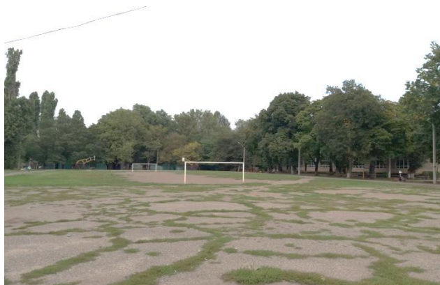
Фото 2.3.1. Територія стадіону школи

майданчики. Покриття існуючих майданчиків та асортимент МАФ не відповідають сучасним вимогам і потребують відновлення.