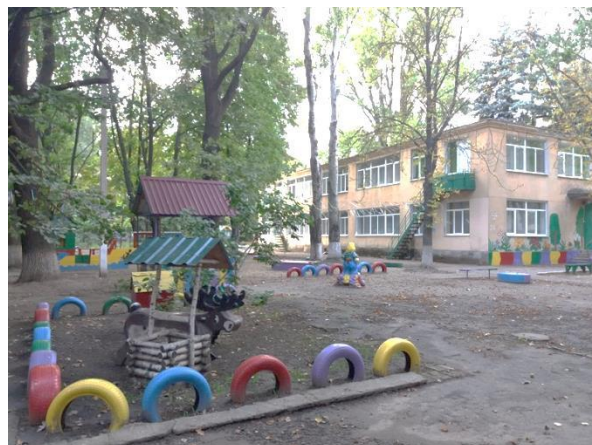
Фото 2.3.2. Територія дитячого садку

Обстеження стану благоустрою торгових, спортивних, лікувальних закладів, що знаходяться на території кварталу, також продемонструвало невідповідність сучасним нормативам та вимогам. Відсутність відповідного функціонального зонування, обладнання МАФ, стан озеленення та покриття свідчать про необхідність проведення заходів по комплексному благоустрою територій цих підприємств.