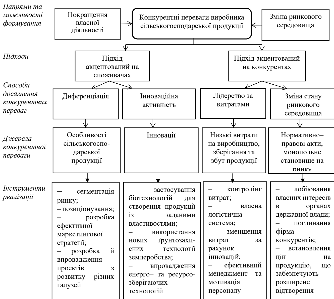
Рисунок 1 – Система формування конкурентних переваг виробників сільськогосподарської продукції України на зовнішніх ринках

на зовнішніх ринках, а й об'єктивною необхідністю, особливо коли йдеться про стійкість конкурентної переваги.