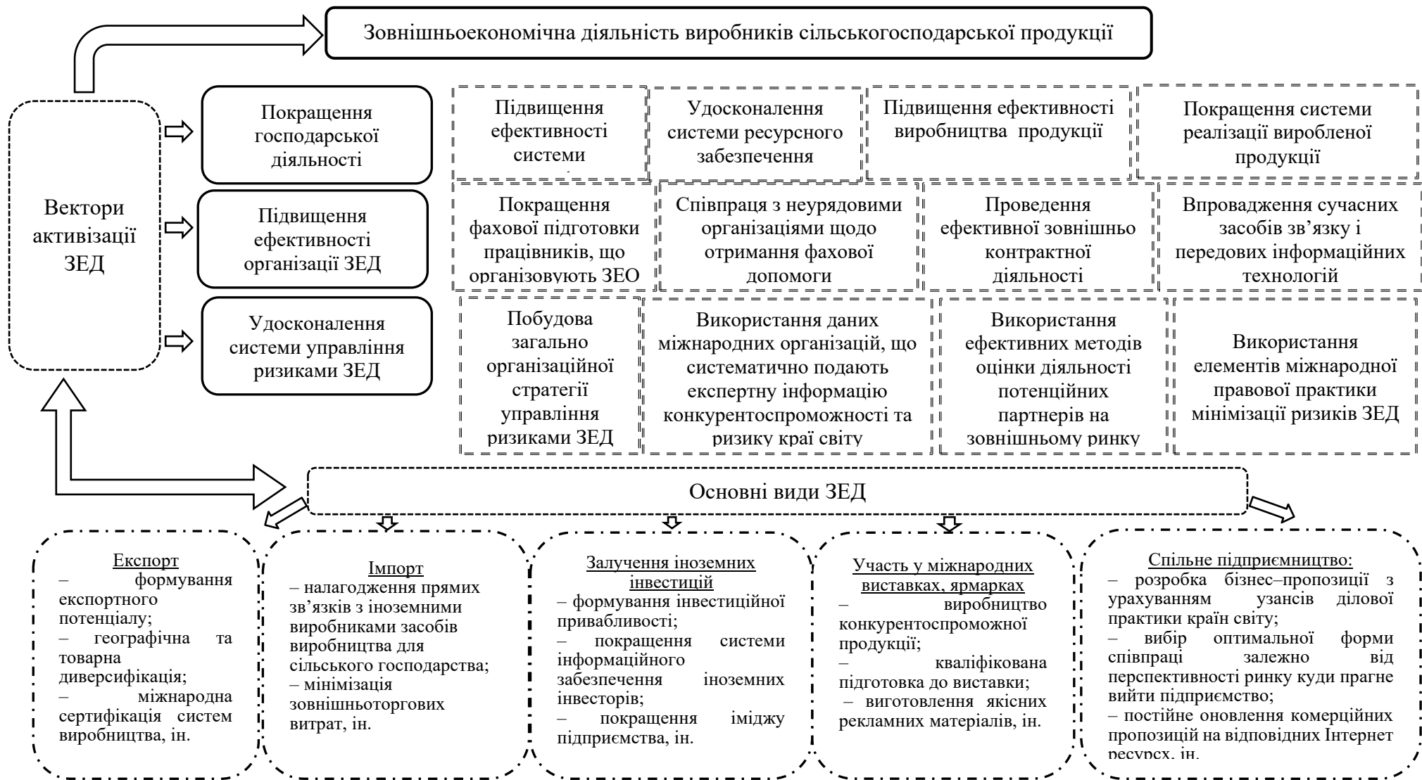
Рисунок 5 – Модель активізації зовнішньоекономічної діяльності виробників сільськогосподарської продукції України