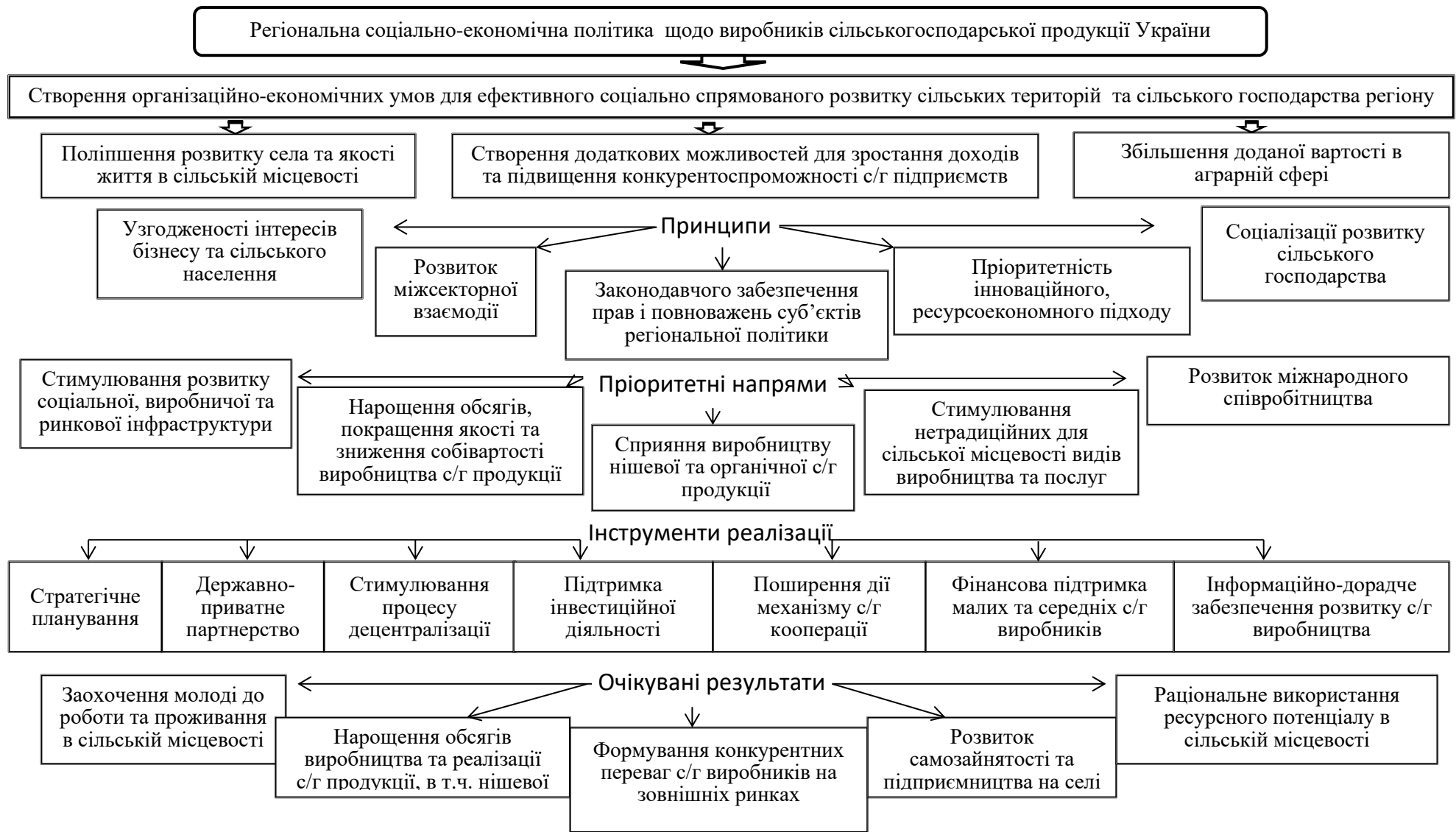
Рисунок 3 – Пріоритети регіональної соціально-економічної політики щодо виробників сільськогосподарської продукції України