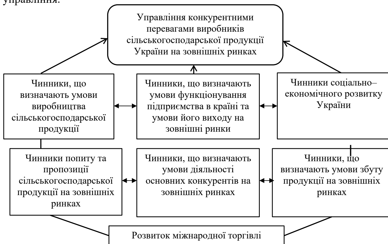
Рисунок 2 – Основні групи чинників управління конкурентними перевагами виробників сільськогосподарської продукції України на зовнішніх ринках

Акцентовано увагу на необхідності використання суб'єктами господарської діяльності, котрі функціонують або планують виходити на зовнішні ринки, особливої системи управління конкурентними перевагами заснованої на системі їх управління на національному рівні. В роботі запропоновано системну модель управління конкурентними перевагами виробників сільськогосподарської продукції України на зовнішніх ринках в рамках якої: визначено об'єкт та суб'єкт управління; обґрунтовано мету, функції, методи та принципи управління; визначено вплив чинників внутрішнього та зовнішнього середовища на управління.