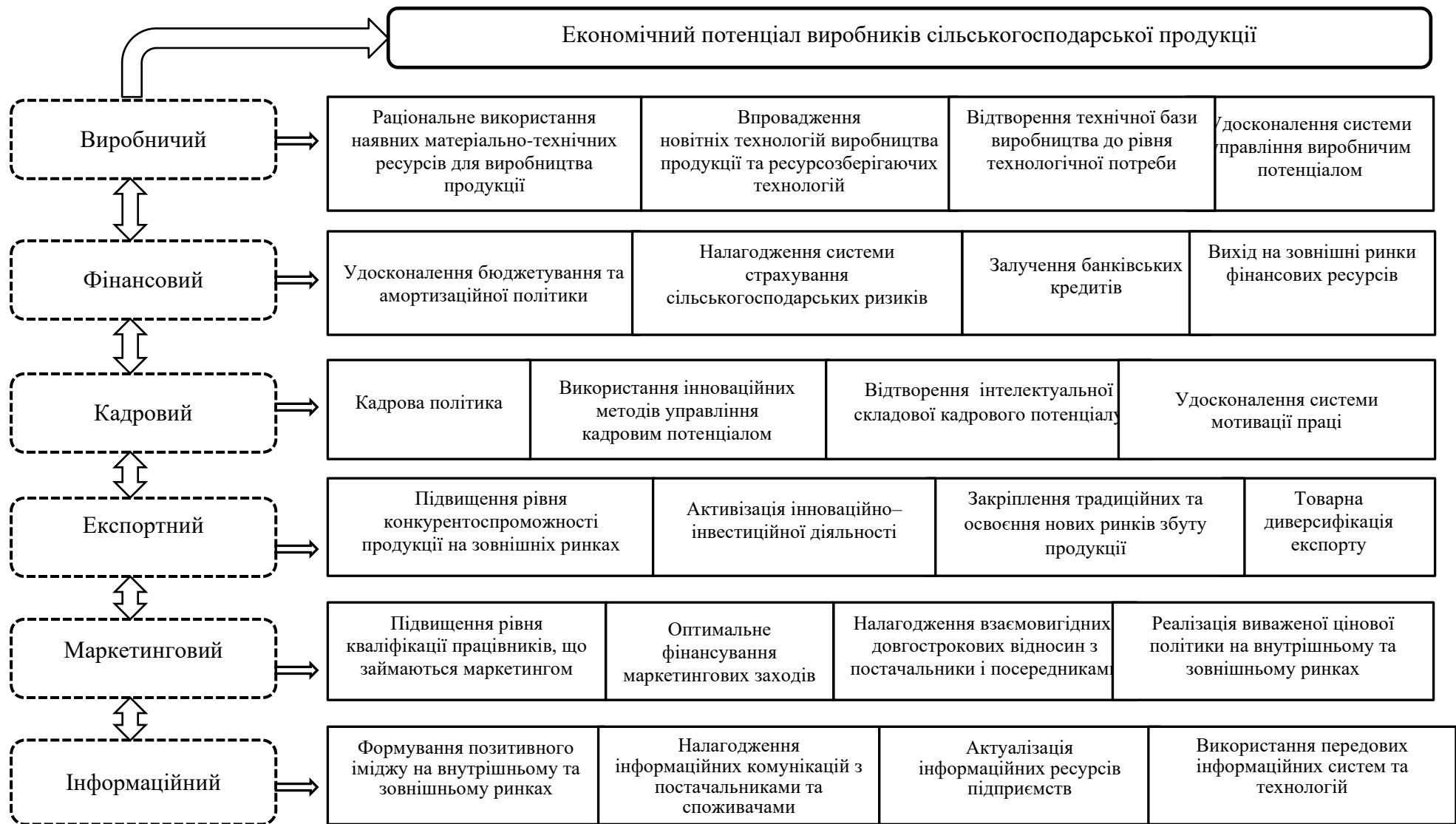
Рисунок 4 – Напрями розвитку основних складових економічного потенціалу виробників сільськогосподарської продукції України в умовах функціонування на зовнішніх ринках